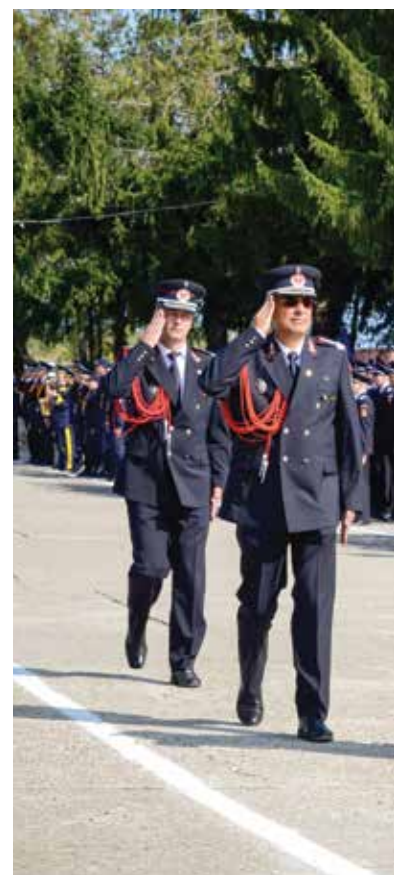
autor: plutonier adjutant șef Sebastian FURNEA, UPS foto: plutonier adjutant șef Sebastian FURNEA, UPS